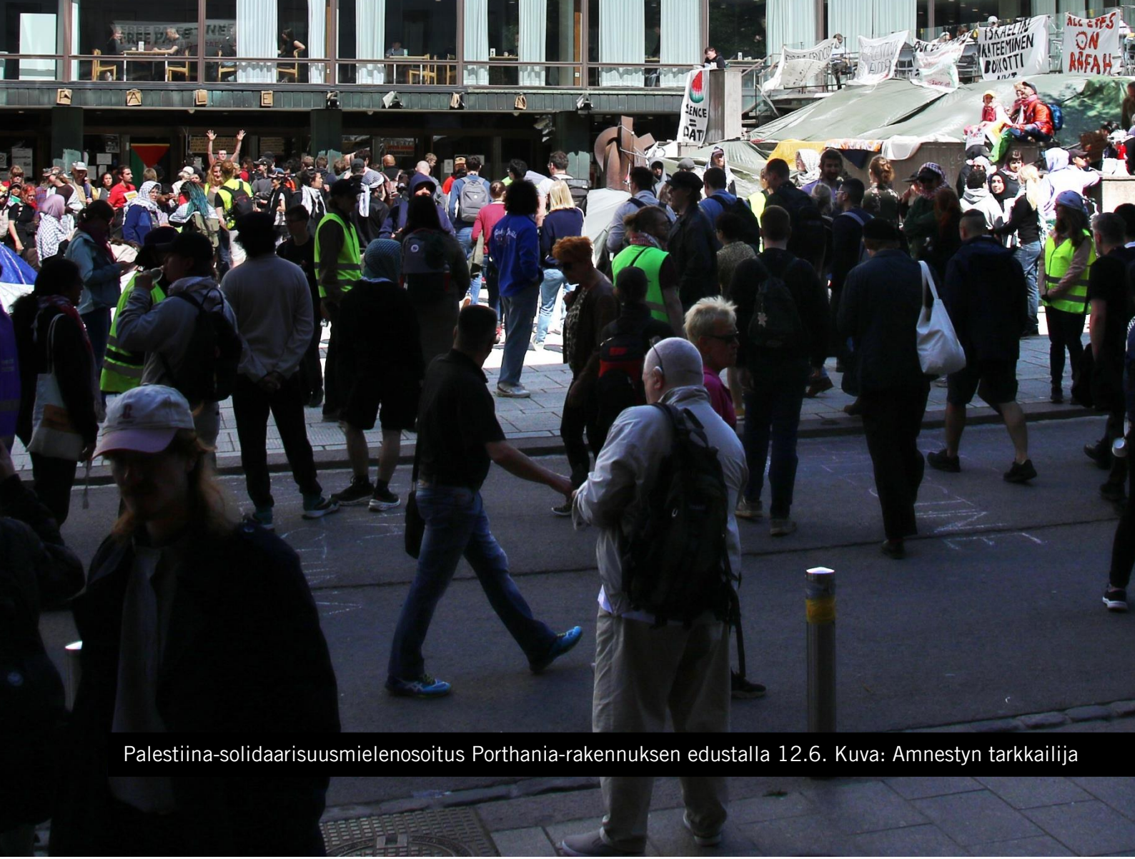
Palestiina-solidaarisuusmielenosoitus Porthania-rakennuksen edustalla 12.6.