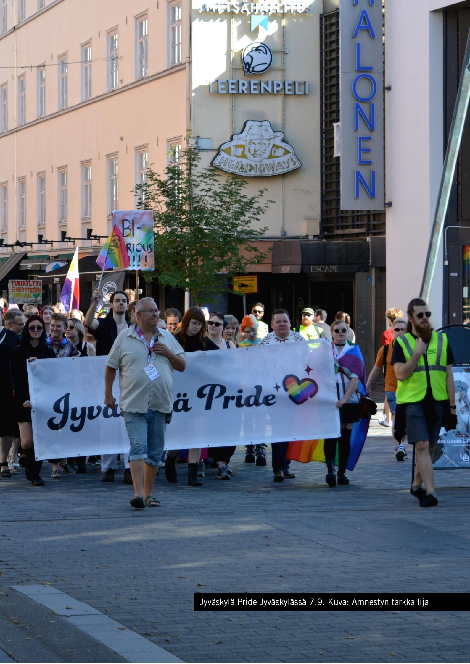
Jyväskylä Pride Jyväskylässä 7.9.