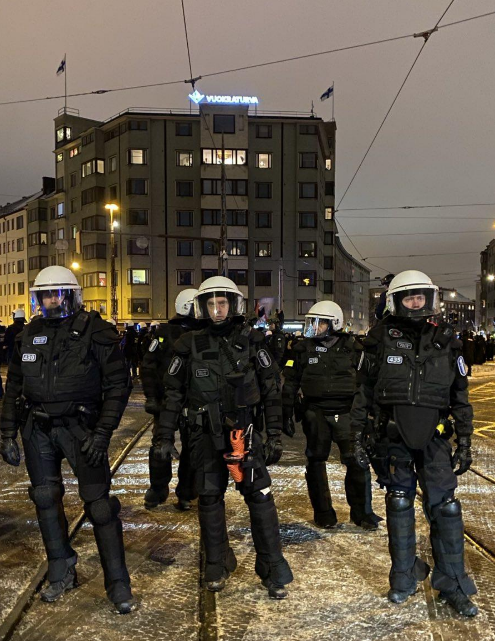
Tunnukseton poliisi FN303-aseen kanssa 6.12.