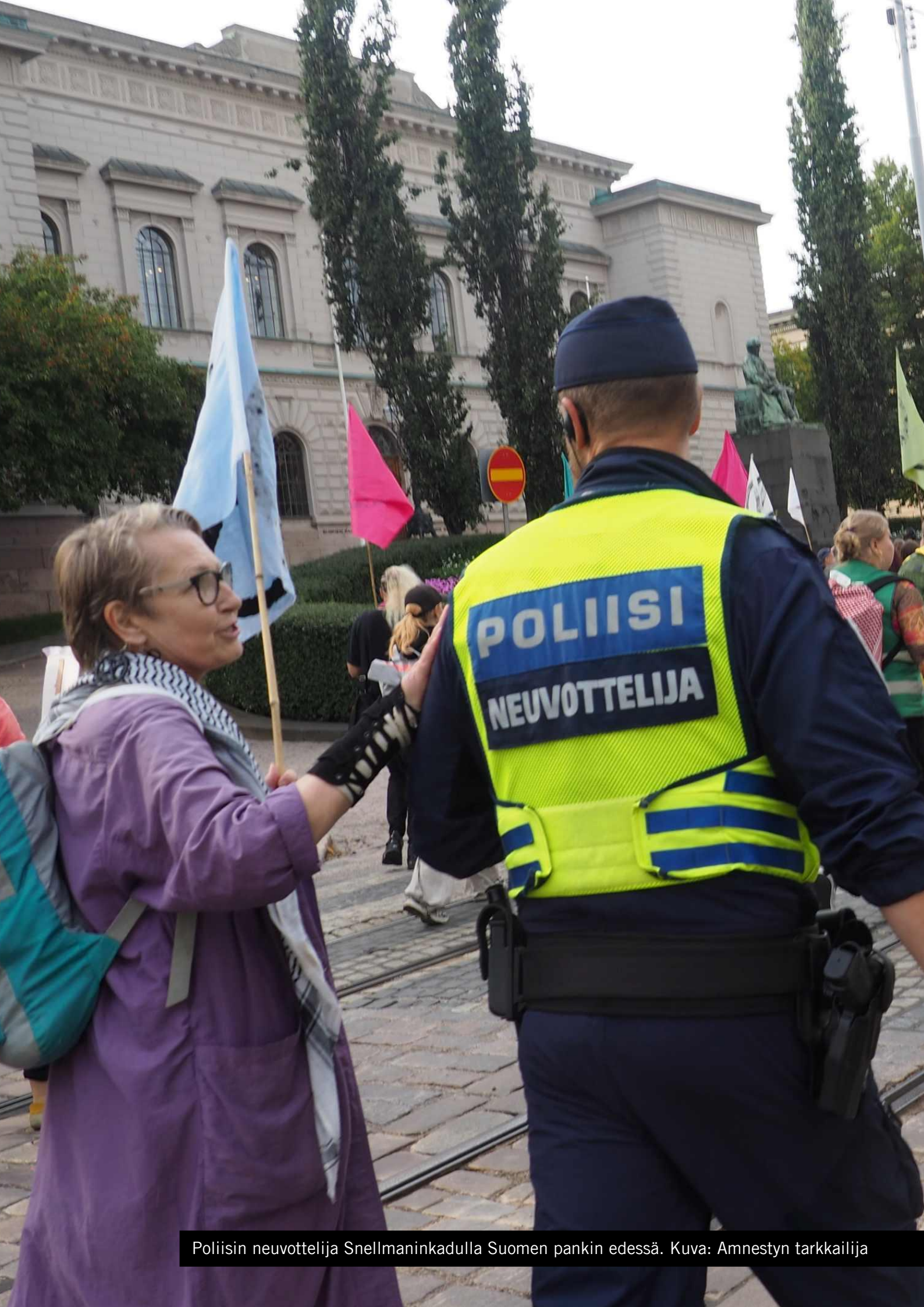
Poliisin neuvottelija Snellmaninkadulla Suomen pankin edessä.